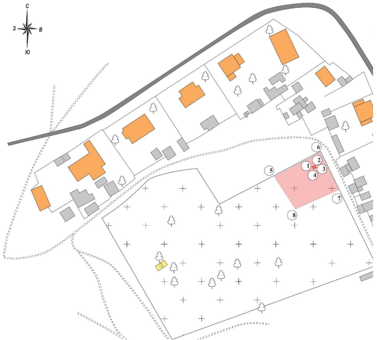
Схема зон охраны объекта культурного наследия регионального значения "Могила неизвестного советского солдата, погибшего в период Сталинградской битвы", расположенного по адресу: Волгоградская область, Городищенский район, с. Карповка, кладбище