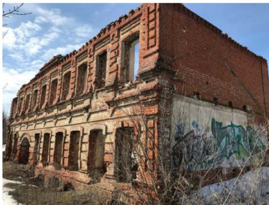
Рис.7 Главный фасад. Вид с юго-востока