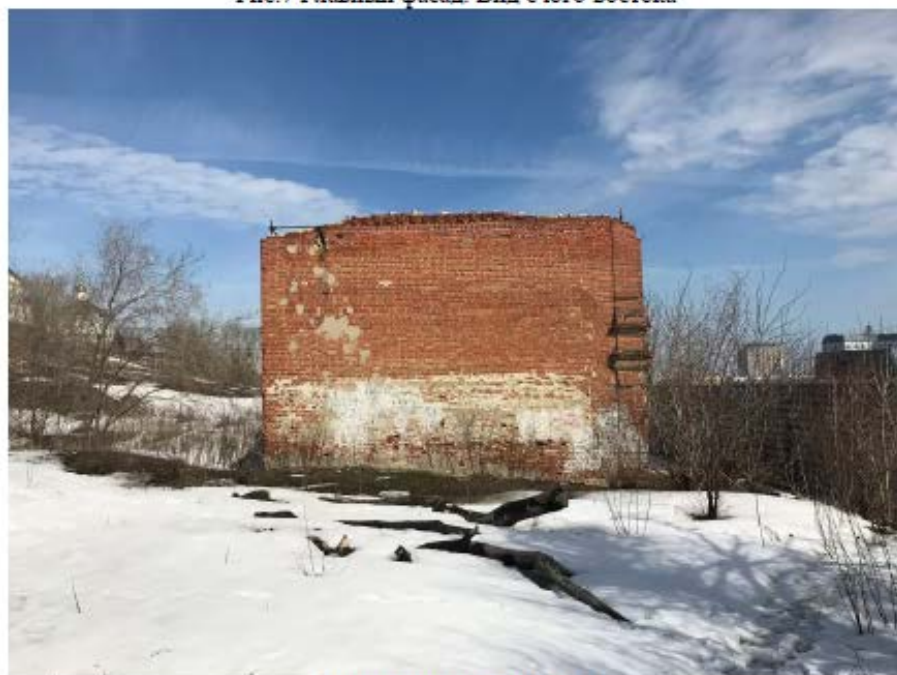
Рис.8 Юго-западный фасад