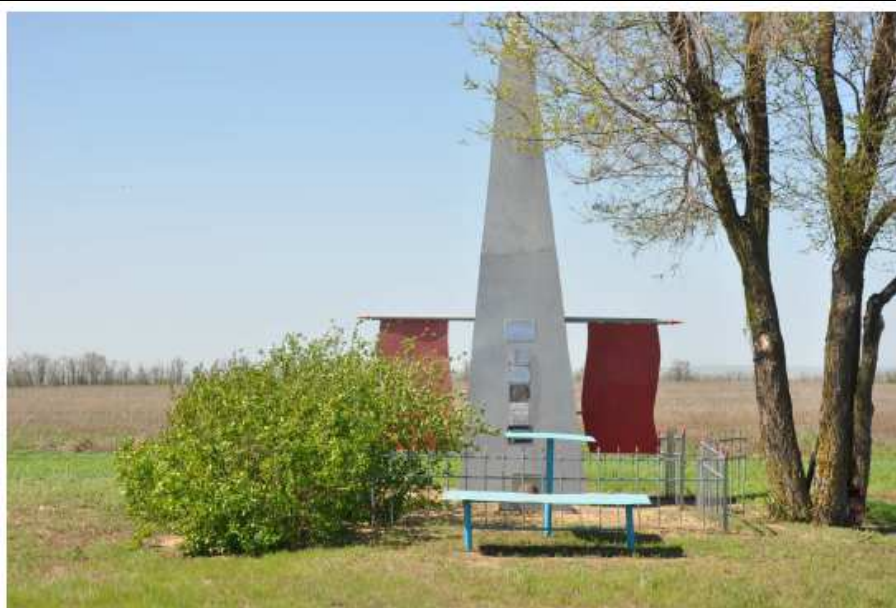
«Братская могила советских воинов, погибших в период Сталинградской битвы», 1942-1943 гг., 1956 г., Вид на вид братскую могилу с юго-востока.