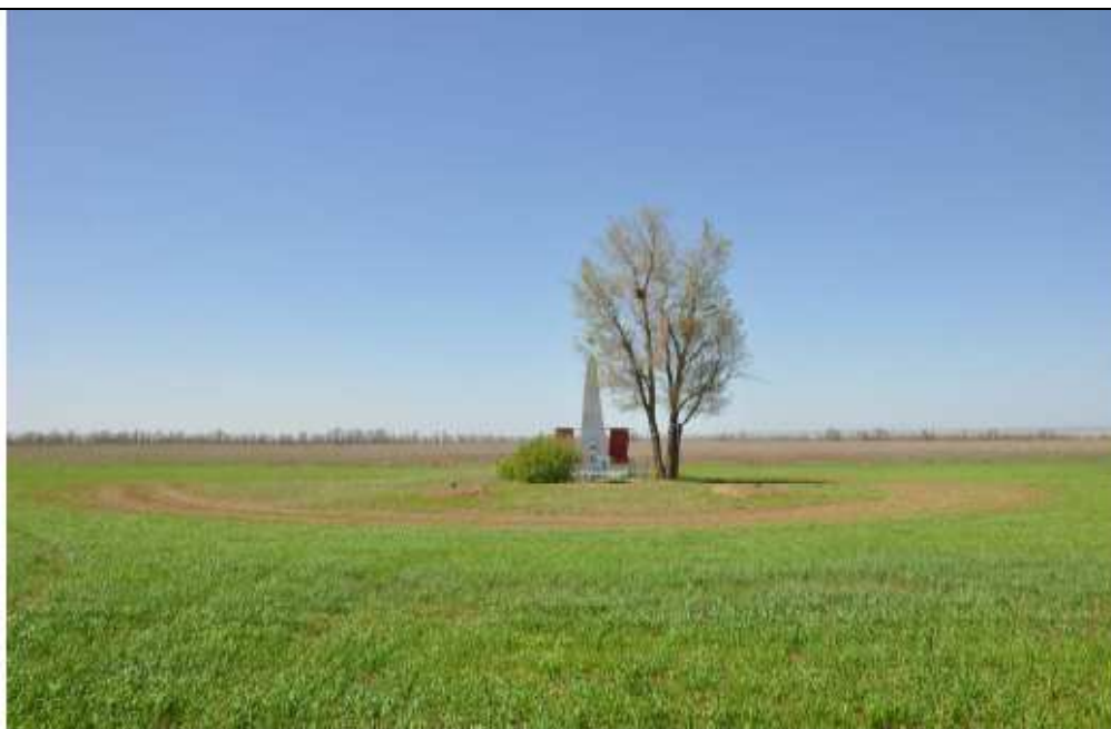
«Братская могила советских воинов, погибших в период Сталинградской битвы», 1942-1943 гг., 1956 г., Вид на вид братскую могилу с юго-востока.