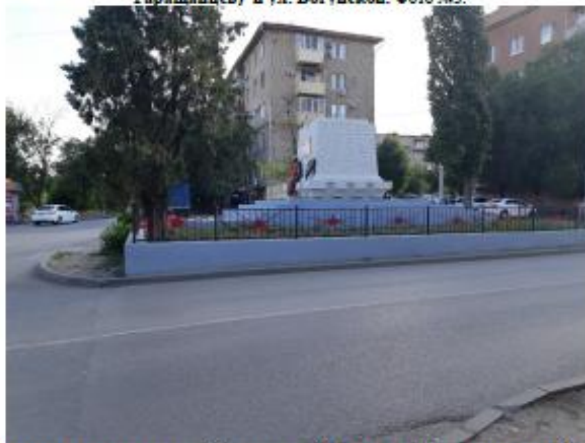
«Братская могила воинов 45-й стрелковой дивизии». Волгоградская область, г. Волгоград, Краснооктябрьский район, угол ул. Тарашанской (правильно-Тарашанцев) и ул. Богунской. Фото №4.