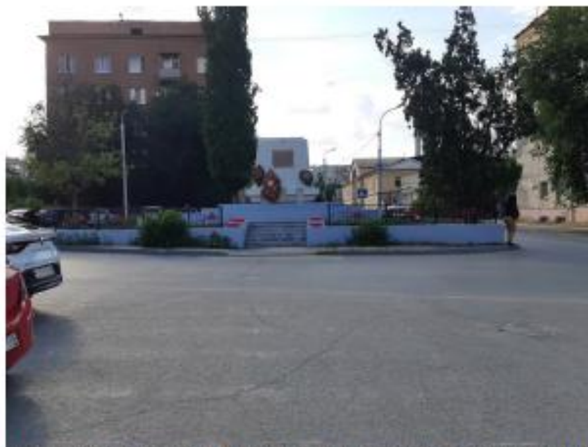
«Братская могила воинов 45-й стрелковой дивизии». Волгоградская область, г. Волгоград, Краснооктябрьский район, угол ул. Тарасовской (правильно-Тарасанцев) и ул. Богувской. Фото №1