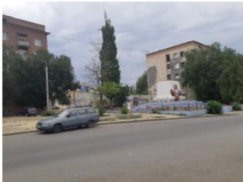
«Братская могила воинов 45-й стрелковой дивизии». Волгоградская область, г. Волгоград, Краснооктябрьский район, угол ул. Тарашанской (правильно-Тарашанцев) и ул. Богунской. Фото №3.