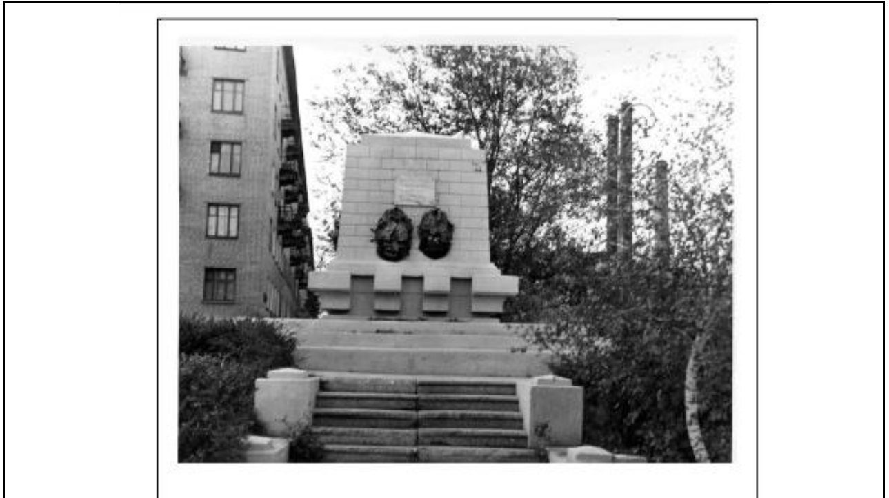
Архивная фотофиксация объекта по состоянию на 1972 год

Архивная и современная фотофиксация объекта культурного наследия регионального значения «Братская могила воинов 45-й стрелковой дивизии», расположенного по адресу: Волгоградская область, г. Волгоград, Краснооктябрьский район, расположенной угол ул. Таращанской (правильно – Таращанцев) и ул. Богунской