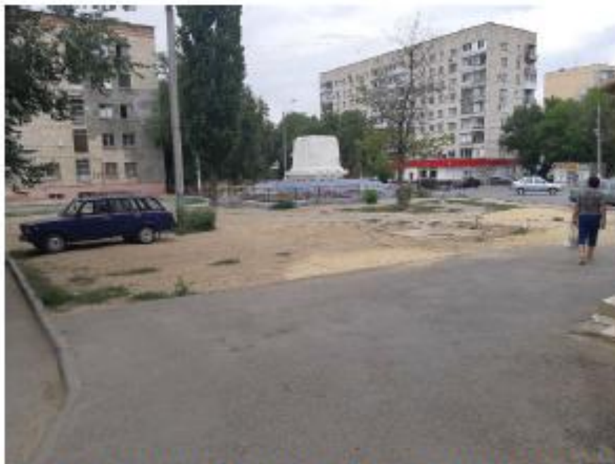
«Братская могила воинов 45-й стрелковой дивизии». Волгоградская область, г. Волгоград, Краснооктябрьский район, угол ул. Таращанской (правильно-Таращанцев) и ул. Богунской. Фото №6