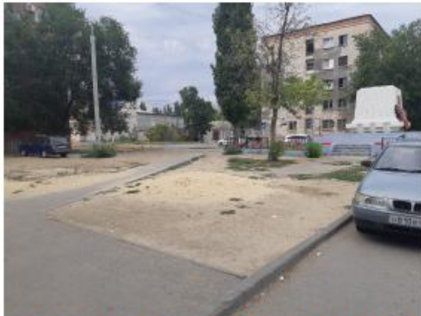
«Братская могила воинов 45-й стрелковой дивизии». Волгоградская область, г. Волгоград, Краснооктябрьский район, угол ул. Таращанской (правильно-Таращанцев) и ул. Богунской. Фото №5