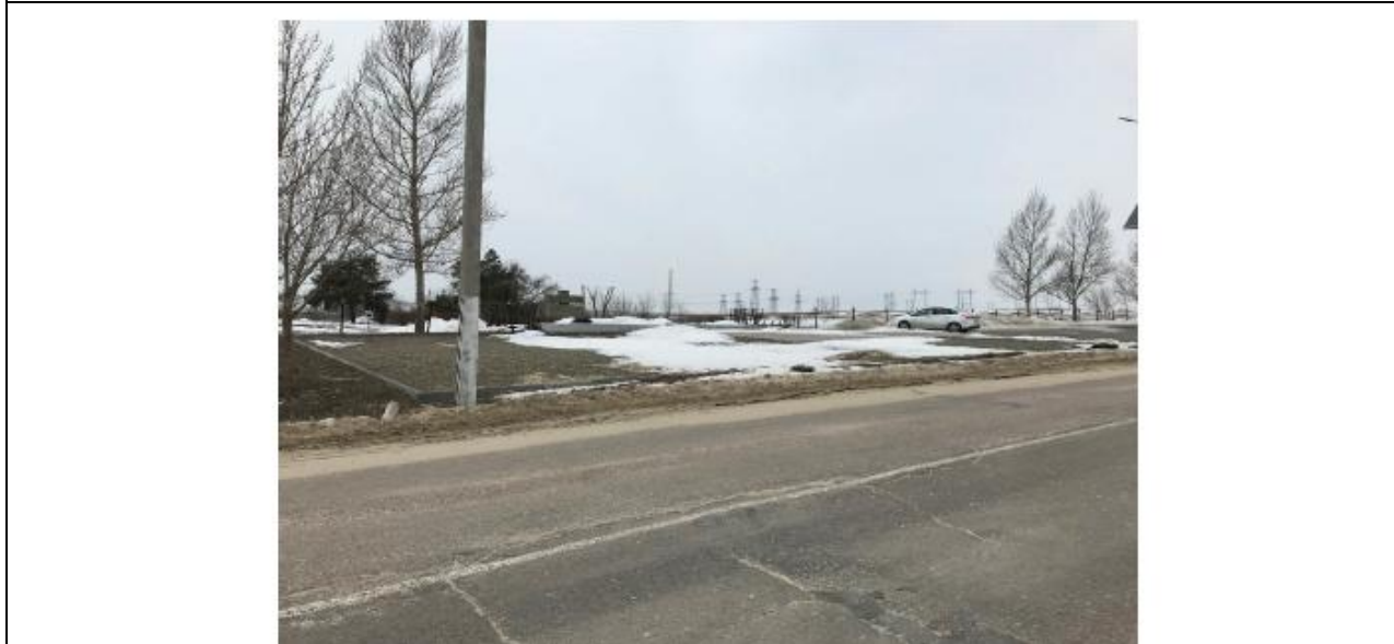
Вид на мемориал со стороны автомобильной дороги, фото 2018 года