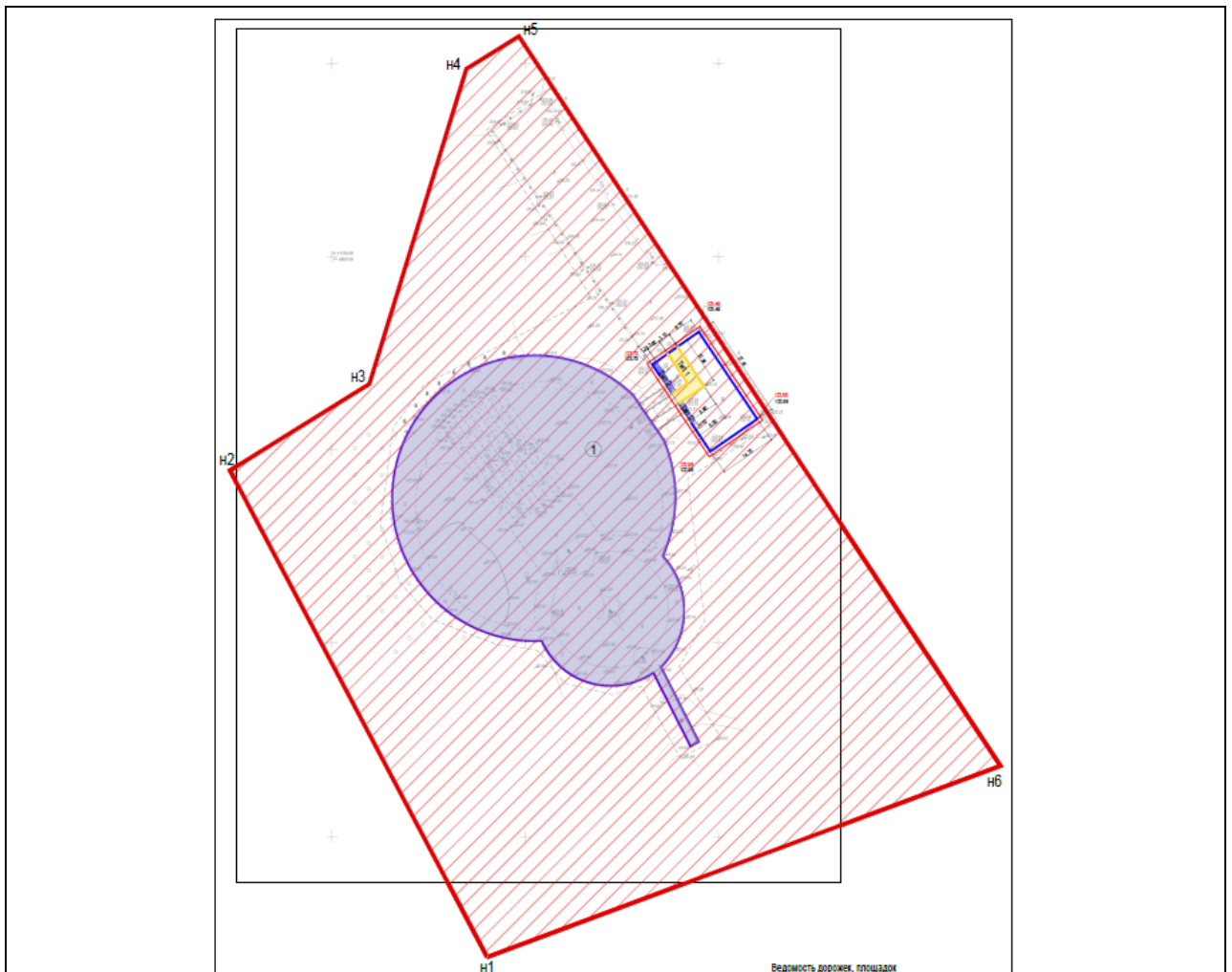
Схема утвержденной границы территории объекта культурного наследия с указанием территории проектирования (выделена цветом)