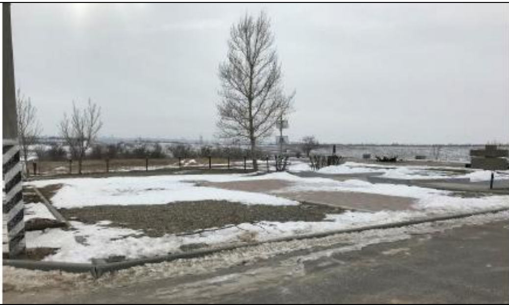
Вид на территорию проектирования ( фото 2018 года)