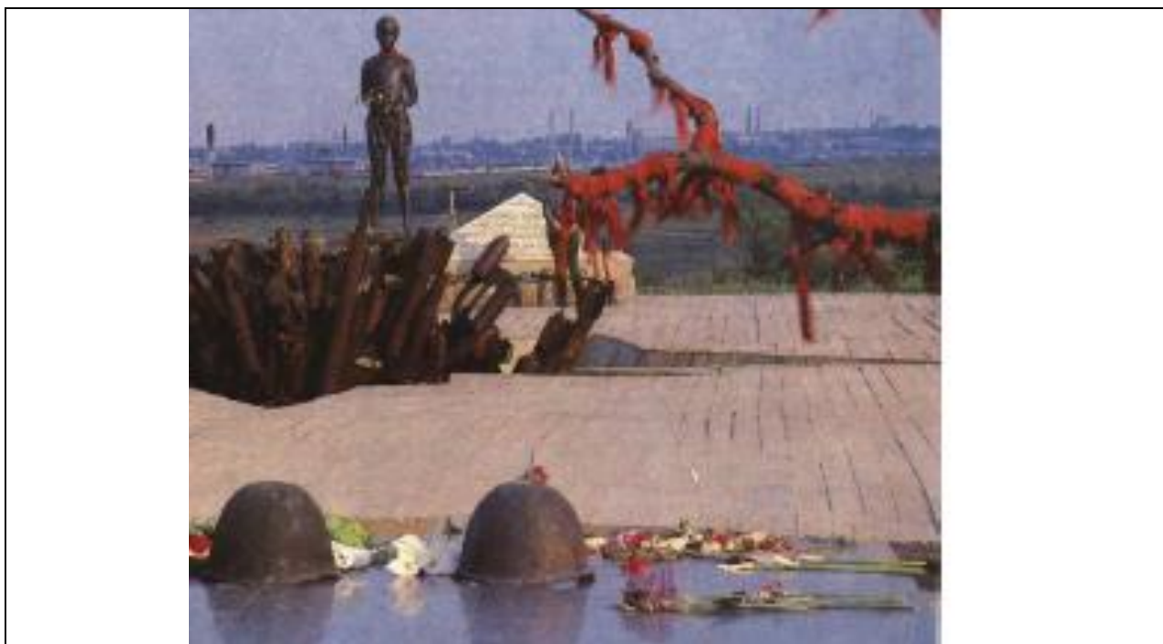
Вид на мемориал ( фото архив 1980-х годов)

Фотофиксация объекта культурного наследия регионального значения "Братская могила воинов 62-й армии, погибших в период Сталинградской битвы", 1942 - 1943 гг., 1975 - 1977 гг., расположенного по адресу: Волгоградская область, Городищенский район, свх. им. 62-й армии, "Солдатское поле", у Московского шоссе» и территории проектирования по состоянию на 2018 год