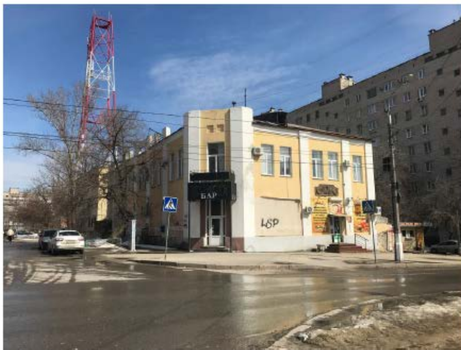
Рис.1 Общий вид объекта с ул. Новороссийская. Вид на объект с северо-запада