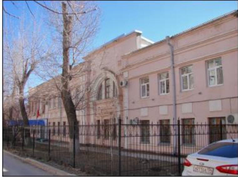
ОКН "Административное здание (Детский приемник-распределитель)" нач. XX в., перестр. в 50-е гг. Волгоград, ул. Ковровская 26. 2015.