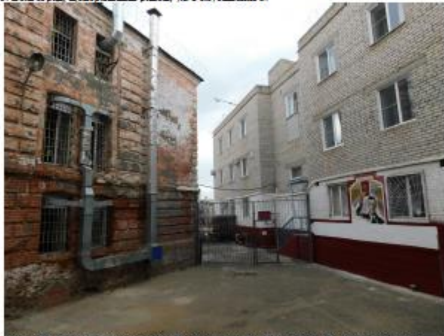
Ф15. Объект культурного наследия «Предприятие УВД, тюрьма», 1884 г., по адресу: г. Волгоград, Центральный район, ул. Голубинская 3.