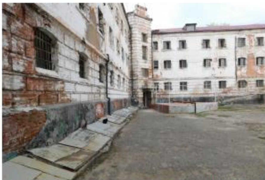
Ф17. Объект культурного наследия «Предприятие УВД, тюрьма», 1884 г., по адресу: г. Волгоград, Центральный район, ул. Голубинская 3.