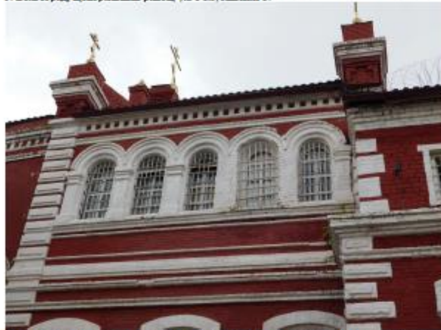
Ф11. Объект культурного наследия «Предприятие УВД, торговля, 1884 г., по адресу: г. Волгоград, Центральный район, ул. Голубинская 3.