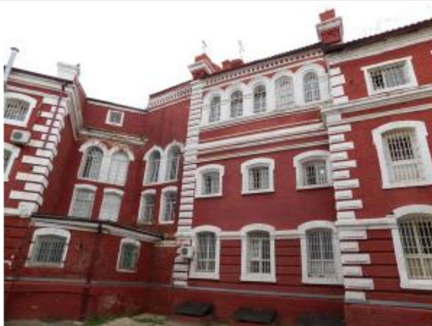
Ф10. Объект культурного наследия «Предприятие УВД, торговля, 1884 г., по адресу: г. Волгоград, Центральный район, ул. Голубинская 3.