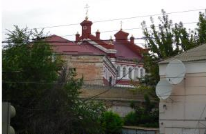
Ф1. Объект культурного наследия «Присеченские УВД, торжма», 1884 г., по адресу: г. Волгоград, Центральный район, ул. Голубинская 3.