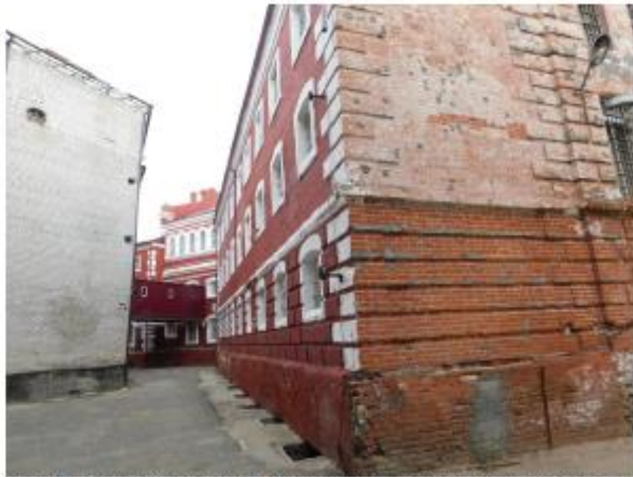
Ф14. Объект культурного наследия «Предприятие УВД, тюрьма», 1884 г., по адресу: г. Волгоград, Центральный район, ул. Голубинская 3.