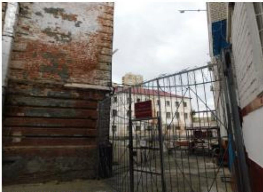
Ф16. Объект культурного наследия «Предприятие УВД, тюрьма», 1884 г., по адресу: г. Волгоград, Центральный район, ул. Голубинская 3.